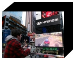
Hyundai: Interaktives XXL-Videospiel