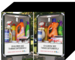
2-in-1: Lenticular-Plakat zeigt zwei Motive