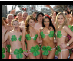
Air Lingus: Nackte Tatsachen