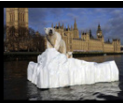
Globale Erwärmung: Eisbär gesichtet